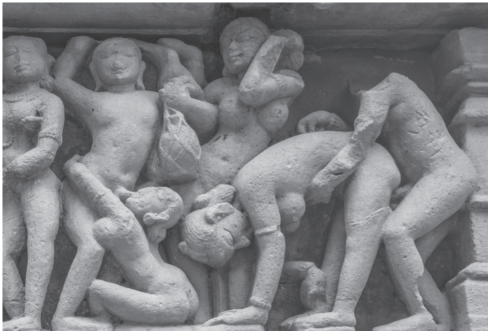
Kamasutra-Darstellungen von der Fassade des Khajuraho-Tempels in Indien (10.-11. Jhdt n. Chr.).